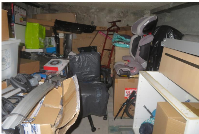
Place de stationnement intérieure – lot n° 59 : Il s'agit de la place numéro 19.